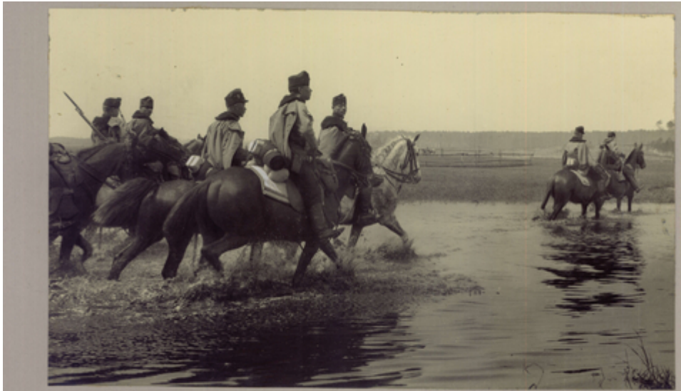
121. Am Vormarsch zum San. Husaren durchqueren einen Fluss.

Am Vormarsch zum San. Husaren durchqueren einen Fluss