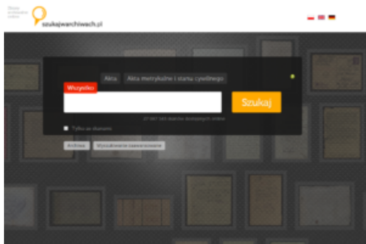
Strona tytułowa (wyszukiwarka) serwisu szukajwarchiwach.pl

Jest to centralny serwis Archiwów Państwowych, którego obsługę techniczną wykonuje Narodowe Archiwum Cyfrowe (to jedno z 33 archiwów państwowych w Polsce). Znajdziemy więc tutaj inwentarze i kopie cyfrowe archiwaliów z całego kraju.