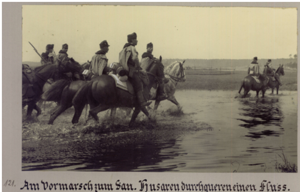
Am Vormarsch zum San. Husaren durchqueren einen Fluss