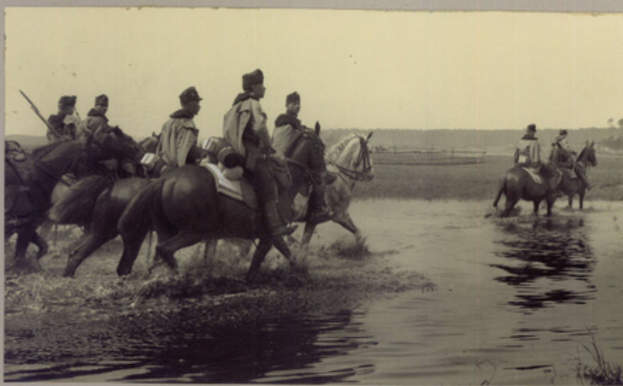
121. Am Vormarsch zum San. Husaren durchqueren einen Fluss.

Am Vormarsch zum San. Husaren durchqueren einen Fluss